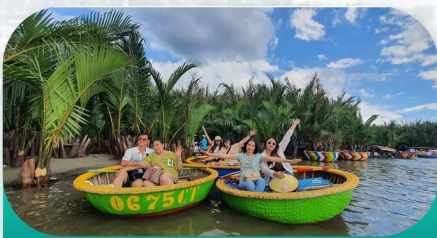
Hoi An Basket Boat