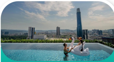
Hotel Journal ou Capri