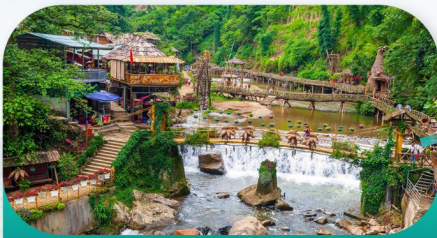
Cat Cat Village Sapa