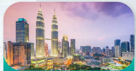
Petronas Twin Towers