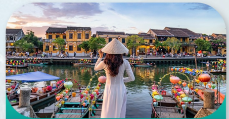
Hoi An Ancient Town