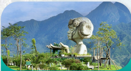
Moana View Sapa