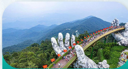
Golden Bridge Ba Na Hills