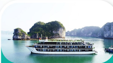
La Casta Cruises