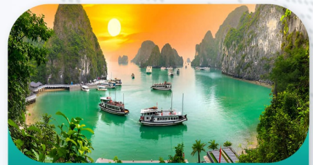
Ha Long Bay