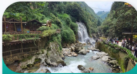
Tien Sa Waterfall