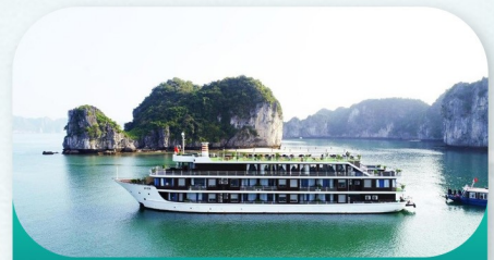
La Casta Cruises