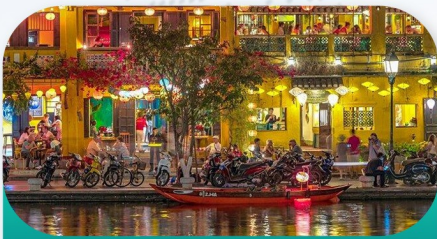
Hanoi Old Quarter