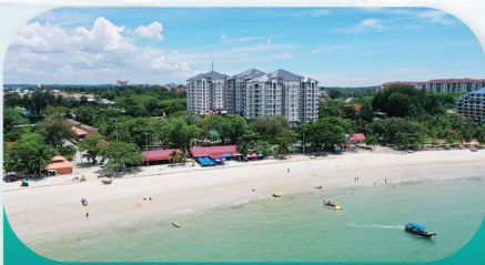
Port Dickson Beach