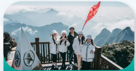
Mount Fansipan Peak