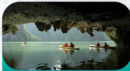
Ninh Binh Caves